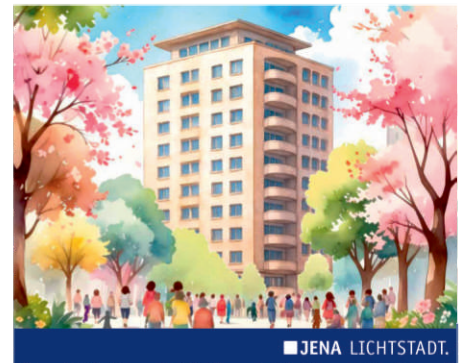
■ JENA LICHTSTADT.